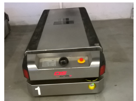
La tortue n° 1 au repos

Chaque jour, les tortues font plus de 160 trajets à 6 km/h En un an, elles parcourent plus de 26 000 kilomètres. L'équivalent d'un aller/retour à Hawaii !